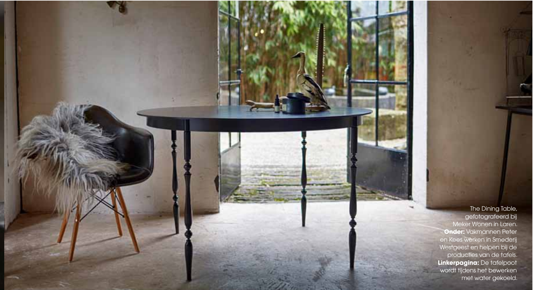
The Dining Table, gefotografeerd bij Meker Wonen in Laren. Onder: Vakmannen Peter en Kees werken in Smederij Westgeest en helpen bij de producties van de tafels. Linkerpagina: De tafelpoot wordt tijdens het bewerken met water gekoeld.